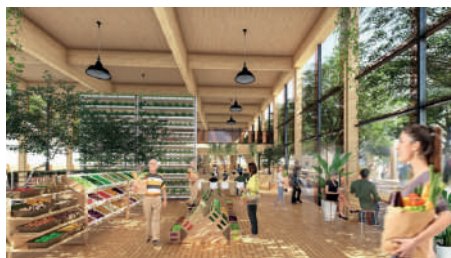
Нов затворен пазар